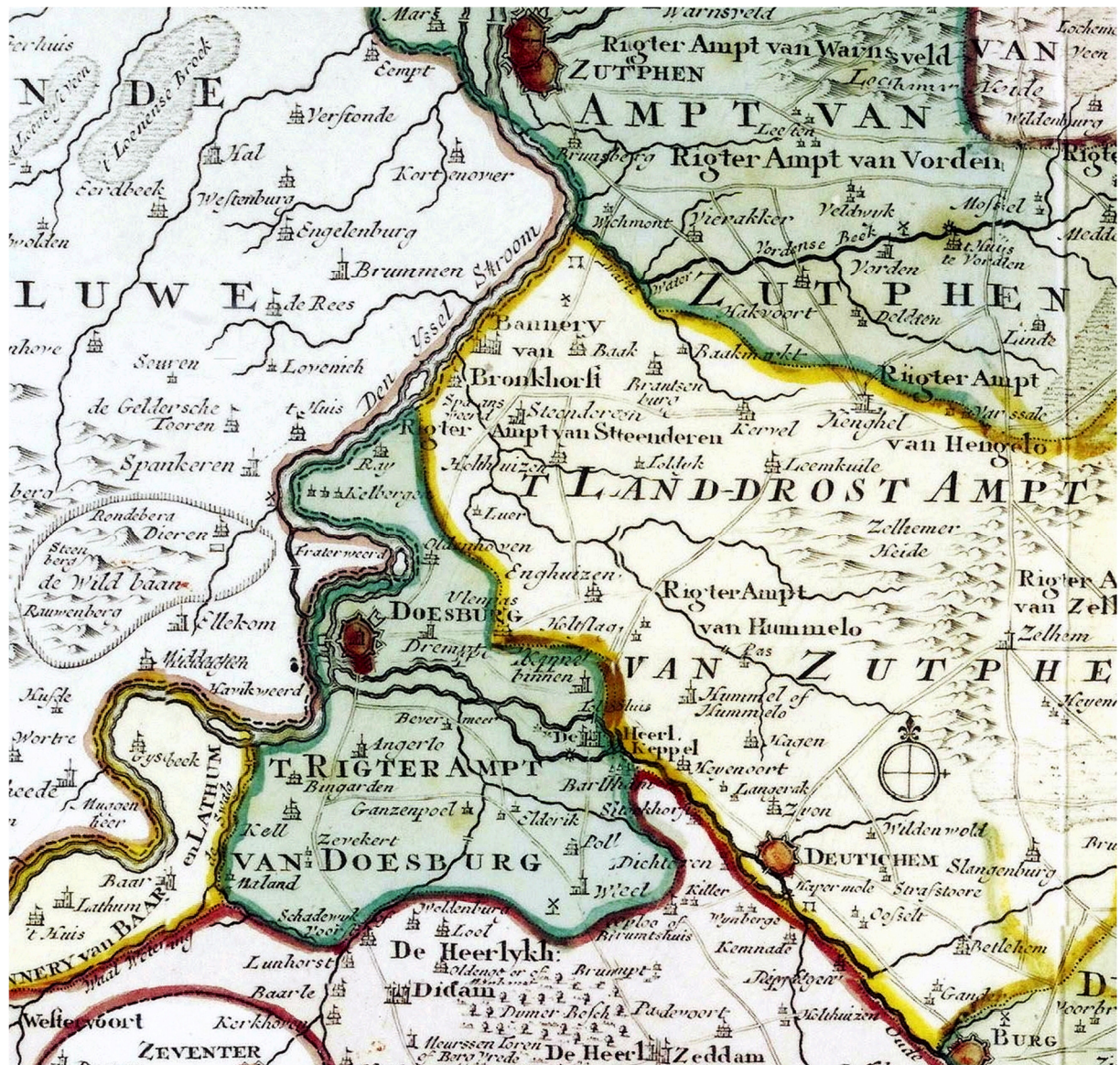
Nieuwe kaart van 't Kwartier Zutphen. Noordelijk deel van Gelre. Uitgegeven bij Isaak Tirion , Amsterdam 1769